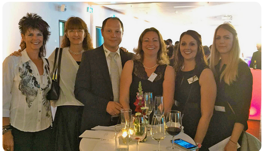
Ein Teil der ASFL SVBL Delegation an der diesjährigen Logistics Hall of Fame Switzerland.

Eröffnet wurde der Abend nach der Begrüssung der Moderato-