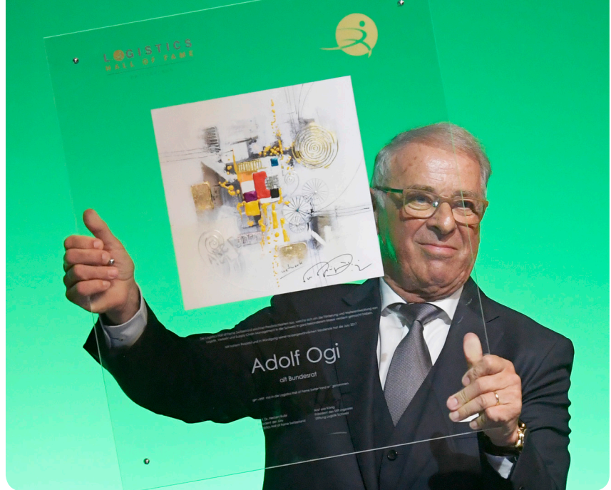
Alt-Bundesrat Dr. h.c. Adolf Ogi – 7. Mitglied der Logistics Hall of Fame Switzerland.

Zwar nur eine von zahlreichen Hall of Fame, aber gesamthaft gesehen eine gute Idee auf erfolgreichem Weg.